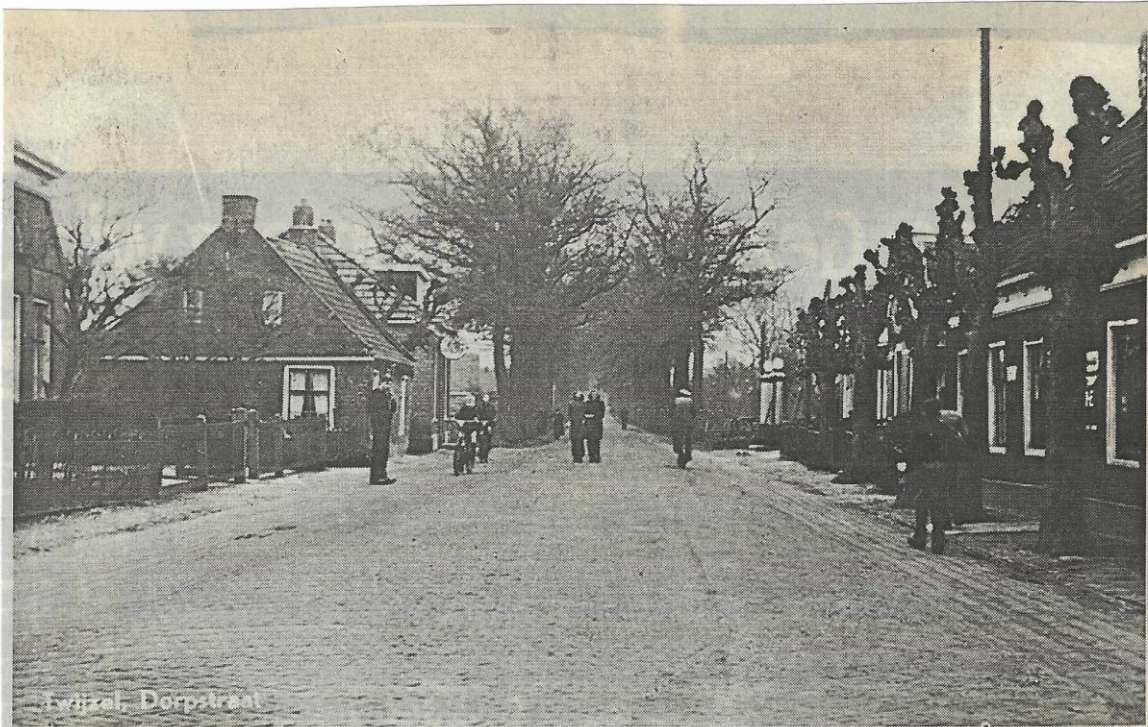
Opname van omstreeks 1950 aan de Optwizel te Twijzel. Het café 'Jachtlust', links, met uithangbord, stond tegenover het huidige pompstation van Hulshoff. De benzinepompen (met de schelpen) waren toen nog aanwezig.